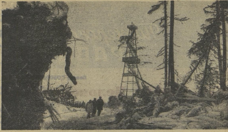
Текст и фото М. СВИЦЕВА.

А буровые ушли от города ещё дальше на север, так далеко, что автобусом не доедешь. Но рабочие на работу всё равно не опаздывают. К их услугам — вертолёты.