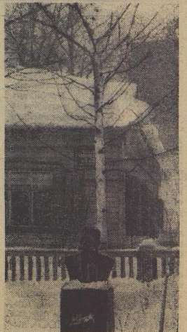
Окончание на 2-й стр.

«Старенькие дома, распухшие от обилия жителей, смотрели друг на друга водянистыми глазами ошкеш недоверчиво... Земля под окнами домов заплёскана помоями, засорена разной дрянью, из подворотни выбегала мелкая стружка, текли грязные ручьи...»